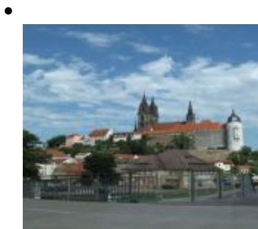
Bild Impressionen Weinerlebnisland Sachsen

Hier Anfrage nach Verfügbarkeit stellen.