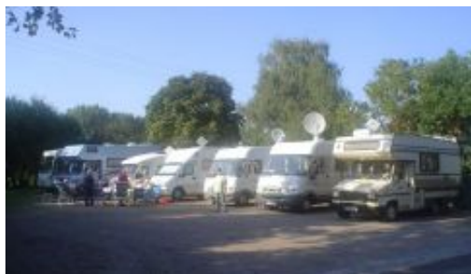
Stellplatz am Landhaus Nassau